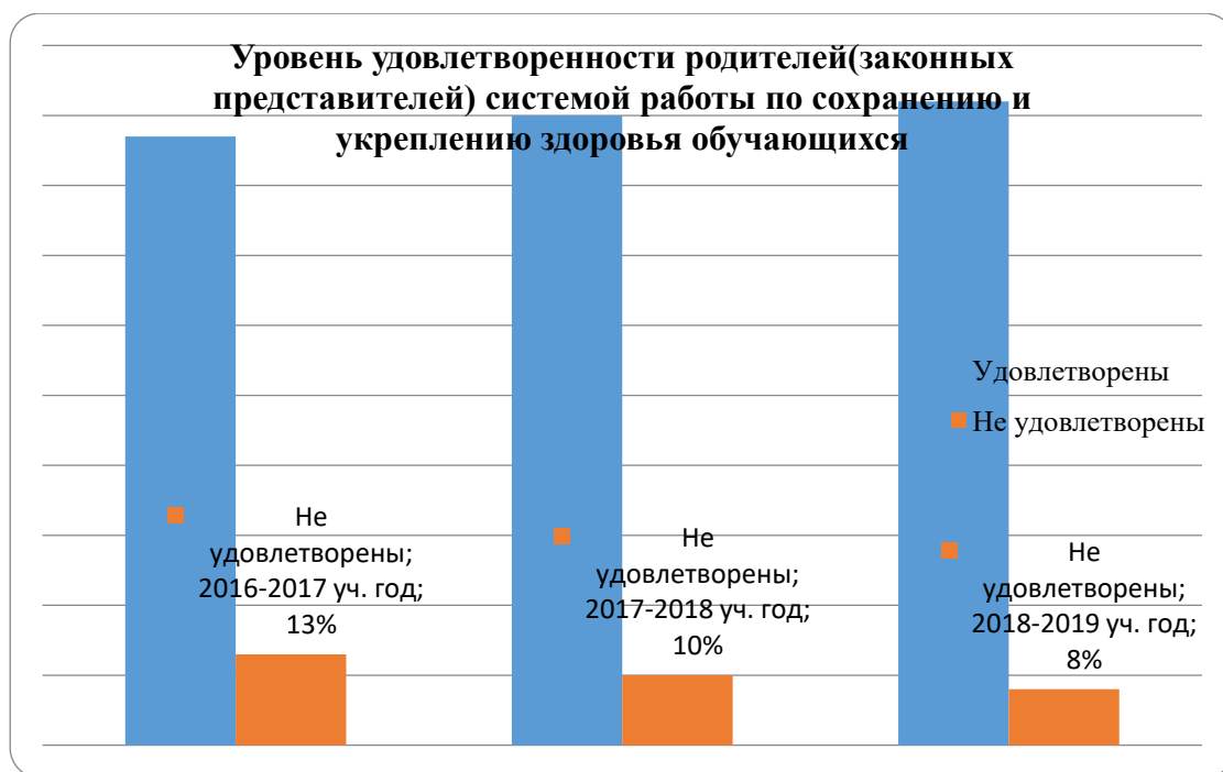
Рисунок 2. Уровень удовлетворенности родителей (законных представителей) системой работы по сохранению и укреплению здоровья обучающихся

Вывод: анализ результатов мониторинга показал что родители(законные представителям) удовлетворены системой работы по сохранению и укреплению здоровья обучающихся